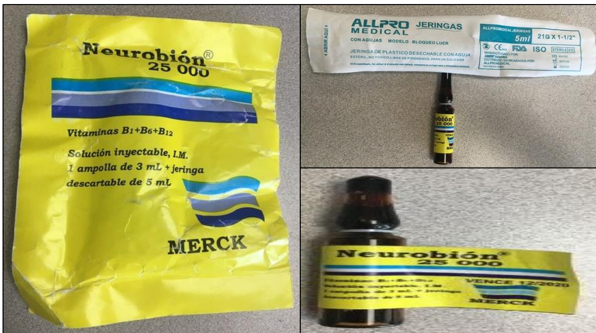
Imagen 1. Medicamento NEUROBIÓN 25 000 falsificado decomisado por el Ministerio de Salud

Con respecto al NEUROBIÓN 25 000, el Ministerio de Salud ya había emitido una alerta el 23 de noviembre de 2016 por la detección en Buenos Aires de Puntarenas del mismo sobre amarillo. Esta alerta puede ser consultada en: https://www.ministeriodesalud.go.cr/index.php/alertas/alerta-por-productos-en-el-mercado/3151-23-de-noviembre-2016-alerta-por-deteccion-de-medicamento-neurobion-falso-en-costa-rica/file