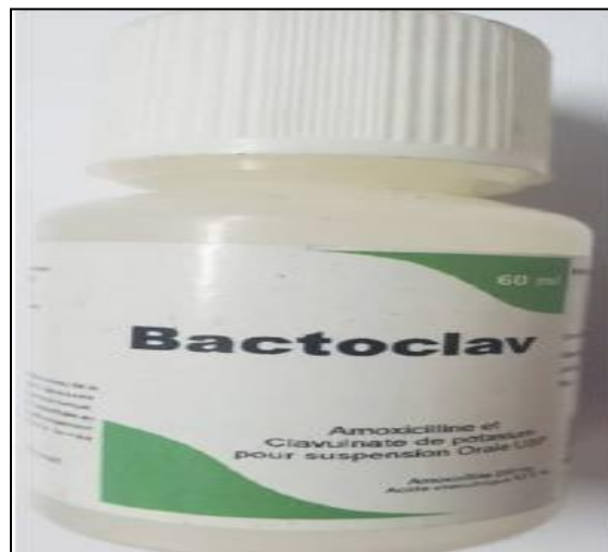
Imagen 2. Medicamento falsificado BACTOCLAV detectado en Haití, lote BSTU0039 expira 05/20