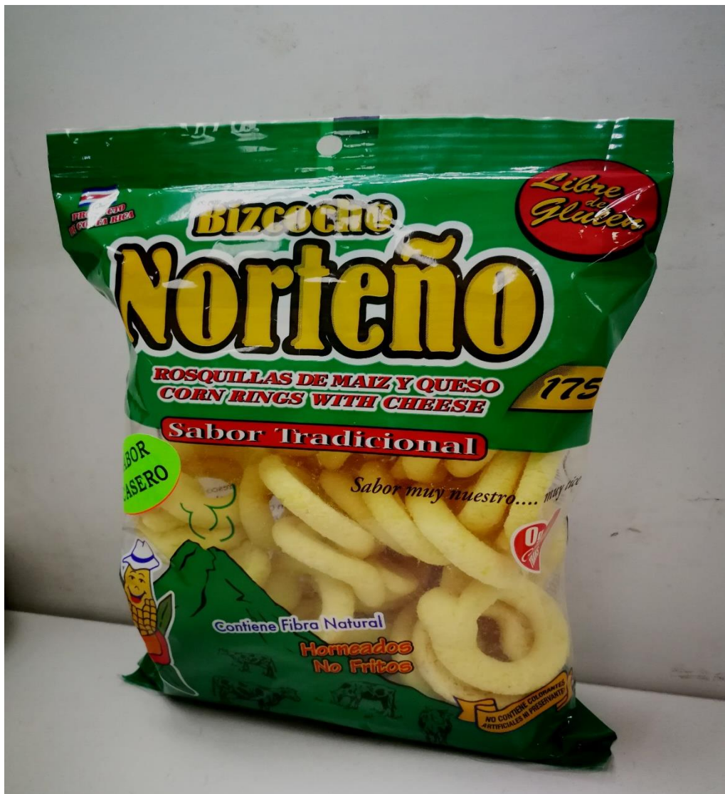
Imagen Producto con la leyenda Libre de Gluten

El Ministerio de Salud, a través de la Dirección de Regulación de Productos de Interés Sanitario, alerta a la población con problemas de celiaquía, para que no consuma el producto denominado “Biscocho Norteño” que contiene en su etiquetado la leyenda “Libre de Gluten”, ya que se ha demostrado que dicho producto podría contener valores de gluten más altos de lo permitido por la normativa reglamentaria vigente, representando un riesgo a la salud de dicha población.