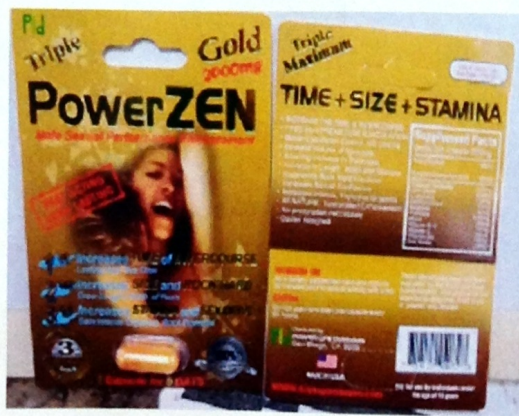
Figura N°1. Triple PowerZEN Gold

Recientemente, la Administración de Drogas y Alimentos de los Estados Unidos (FDA, por sus siglas en inglés) recomendó a los consumidores no comprar o consumir los siguientes productos: