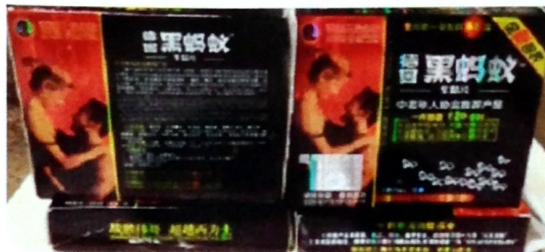
Figura N°2. Triple Zhansheng Weige Chaoyue Xilishi Fuente: Public Notification FDA [12-23-2014]