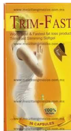
Figura 4. Imagen del producto Trim-Fast Slimming Softgel