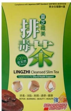
Figura 3. Imagen del producto Lingzhi Cleansed Slim Tea