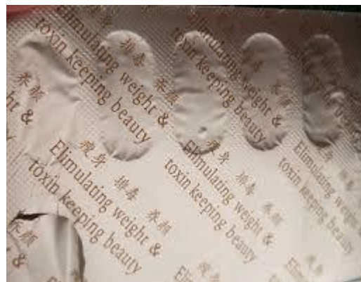
Figura 7. Imagen del producto Elimulating Weight & Toxin Keeping Beauty