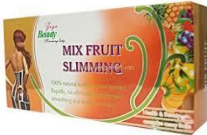
Figura 5. Imagen del producto Mix Fruit Slimming Fuente: Public Notification FDA [09-07-2014]