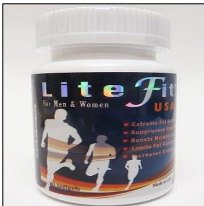
Figura 8. Imagen del producto Lite Fit USA