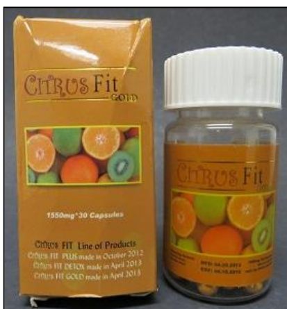
Figura 12. Imagen del producto Citrus Fit Gold Detox