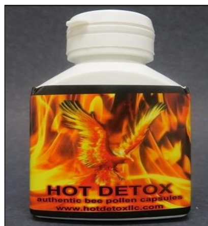
Figura 13. Imagen del producto Hot Detox