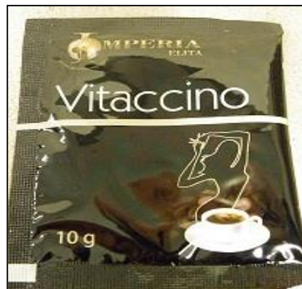
Figura 11. Imagen del producto