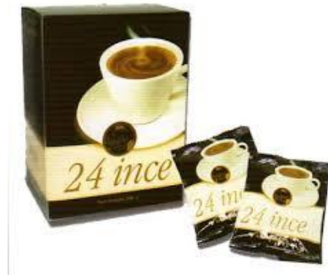
Figura 6. Imagen del producto 24 Ince