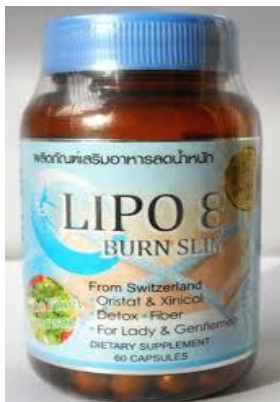
Figura 1. Imagen del producto Lipo 8 Burn Slim