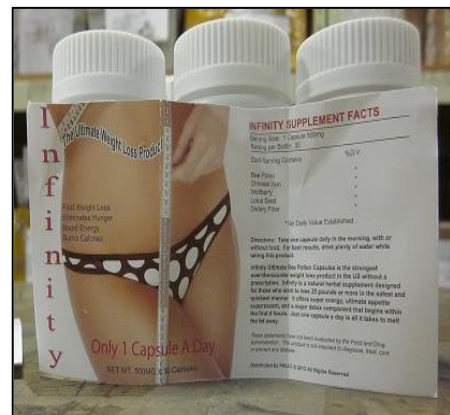
Figura 9. Imagen del producto Infinity Fuente: Public Notification FDA [04-10-2014]