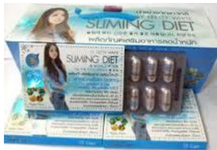
Figura 2. Imagen del producto Sliming Diet By Pretty White