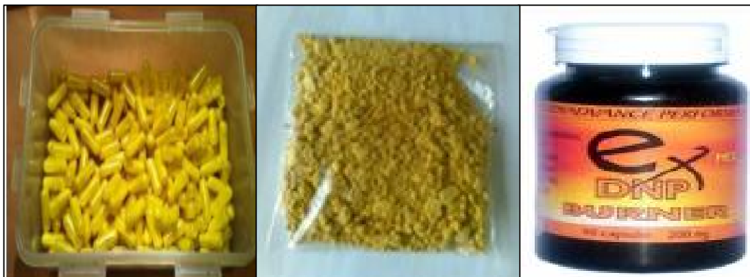
Figura 2. Cápsulas, polvo y presentación para la venta del DNP

El DNP se está comercializando en forma ilegal, principalmente a través de internet, en varias presentaciones: polvo, cápsulas o crema. Un riesgo adicional para la salud, además de los riesgos ya conocidos del DNP, es que estos productos son fabricados en lugares clandestinos que no cumplen los requisitos de manufactura, transporte y almacenamiento.