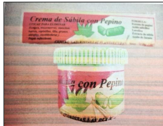
Figura 2. Crema de Sábila con Pepino