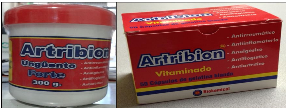
Imagen N° 1. Presentaciones de ARTRIBION que no están registradas en Costa Rica