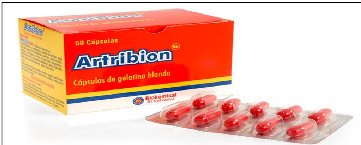
Imagen N° 2. Medicamento ARTRIBION que está registrado en el Ministerio de Salud de Costa Rica