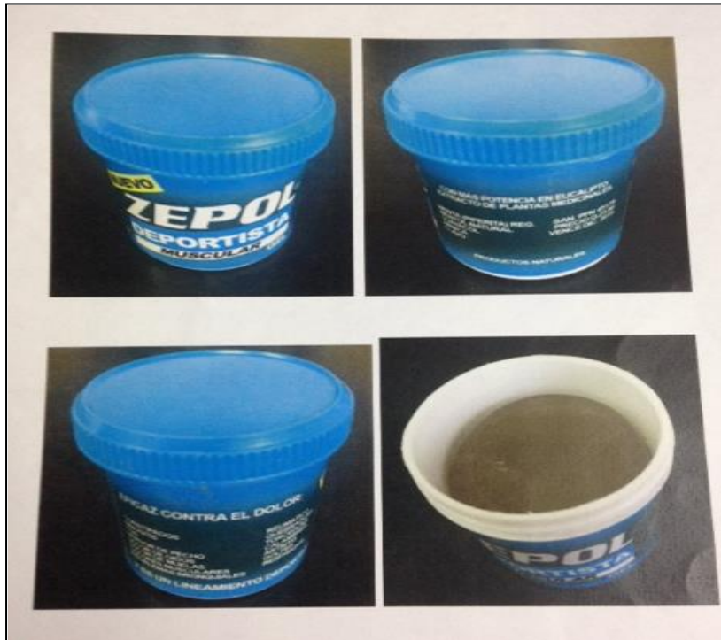
Imagen N° 2. Producto falsificado ZEPOL DEPORTISTA MUSCULAR en gel

Fuente: Carta del 4 de mayo del 2016 suscrita por Asuntos Regulatorios de Laboratorios Zepol S.A.