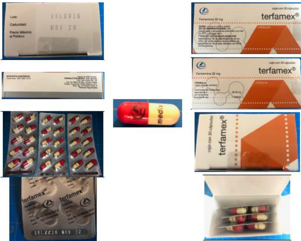
Imagen N° 1. Medicamento TERFAMEX original

La casa farmacéutica Medix, titular del medicamento original, confirmó que se trataba de un falsificado debido a las diferencias con respecto al producto original (ver imágenes N° 1 el producto original versus imágenes N° 2 producto falsificado), las cápsulas originales de TERFAMEX cuenta con el logo del laboratorio, además la caja viene con un sello de seguridad que trae el logo en un holograma.