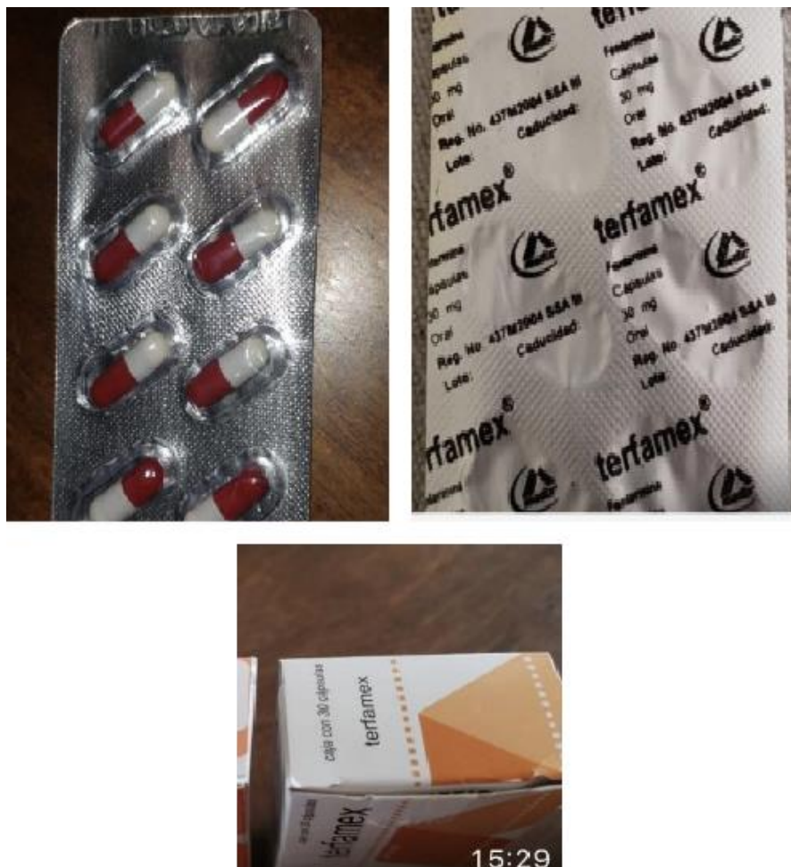
Imagen N° 2. Medicamento TERFAMEX falsificado.

Se reportan los siguientes lotes emitidos por el laboratorio los cuales pertenecen al producto original y son los comercializados hasta la fecha.