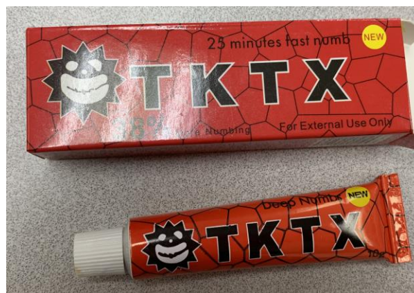
Anexo 1. Fotografía de algunos ejemplos del productos TKTX comercializados ilegalmente en Costa Rica