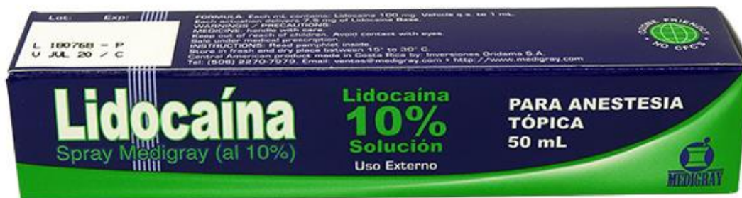
Anexo 1. Fotografía de Lidocaína spray Medigray (al 10%) solución en aerosol de Inversiones Oridama S.A.

El Ministerio de Salud, a través de la Dirección de Regulación de Productos de Interés Sanitario, alerta a la población en general sobre el producto Lidocaína spray Medigray (al 10%) solución en aerosol, registro sanitario 2101-AÑO-0945, promocionado y comercializado en la red social Facebook de manera ilegal e informal.