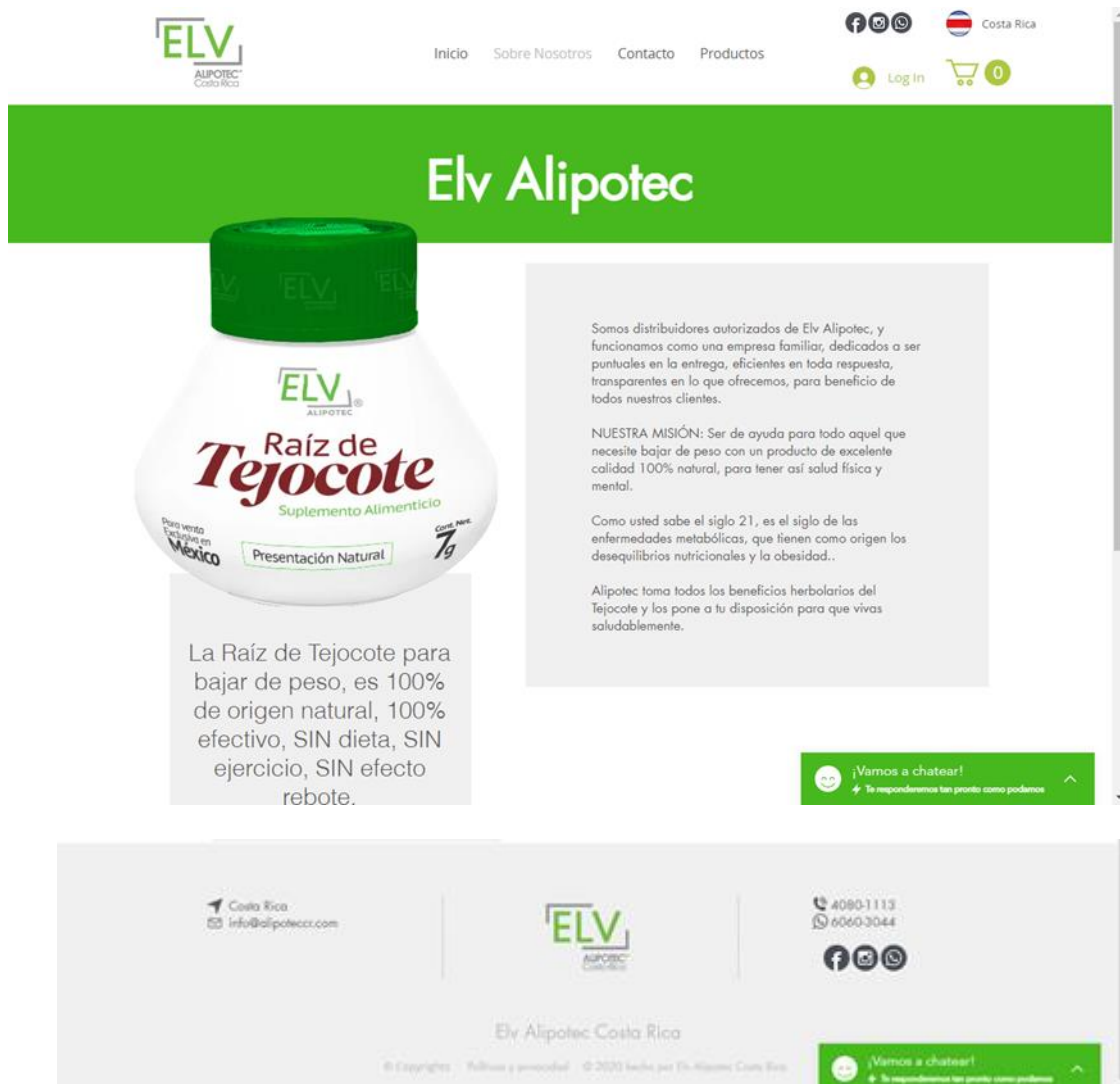
Figura 1: Pantallazos de página web, consultada el 16 de diciembre de 2020.

El Ministerio de Salud, a través de la Dirección de Regulación de Productos de Interés Sanitario, alerta a la población en general sobre la oferta para comercialización para la supuesta pérdida de peso sin efecto rebote, sin dieta ni ejercicio de un producto denominado Elv Alipotec Raíz de Tejocote que carece de registro sanitario. Este se ofrece mediante la página web https://www.alipoteccr.com/sobre-nosotros , varios perfiles de Facebook y cuentas de instagram. Ver figuras 1, 2 y 3.