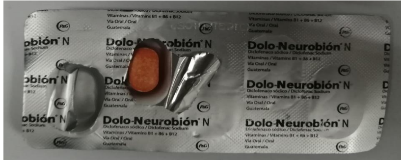
Imagen 1. Tablet de Dolo-NeurobióN N falsificadas agrietadas, con diferentes tonos y recortados los textos en el blíster