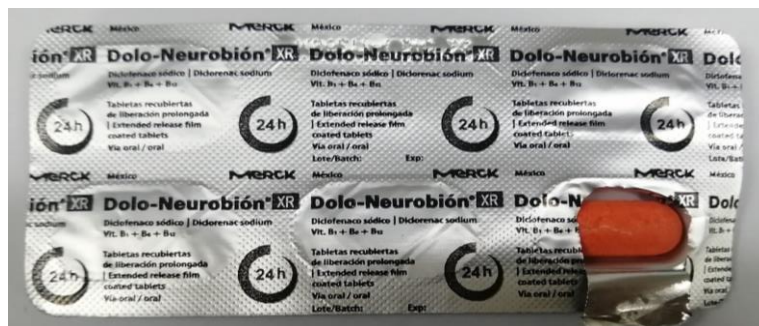
Imagen 3. Blister de Dolo-NeurobióN XR falsificado con los datos en columnas del medicamento cortado