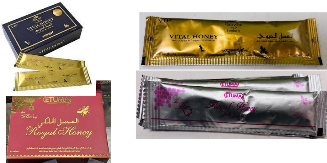
Figura 1. Fotografía de los productos comercializados ilegalmente en Costa Rica

El Ministerio de Salud, a través de la Dirección de Regulación de Productos de Interés Sanitario, alerta a la población en general, sobre los productos Royal Honey y Vital Honey promocionados a través de redes sociales como potenciador sexual, los cuales se encuentran adulterados y no cuentan con registro sanitario vigente en Costa Rica.