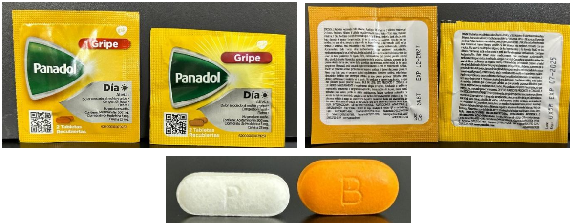
Imagen N°1. En cada fotografía se observa el Panadol Gripe Día falsificado a la izquierda y el original a la derecha.