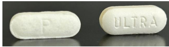
Imagen N°3. En cada fotografía se observa el Panadol Ultra falsificado a la izquierda y el original a la derecha.

Se desconoce si estos medicamentos falsificados contienen otros ingredientes no declarados que puedan ser peligrosos. Asimismo, no se tiene certeza sobre su procedencia ni sobre las condiciones en que fueron elaborados, almacenados, transportados o manipulados. Por lo tanto, su consumo representa un riesgo para la salud pública.