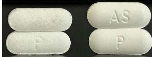
Imagen N°2. En cada fotografía se observa el Panadol Gripe Noche falsificado a la izquierda y el original a la derecha.