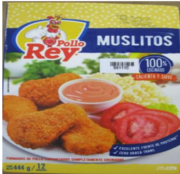
Imagen 1. MUSLITOS DE POLLO COCIDOS, marca POLLO REY, Lote 2508250101

El producto afectado por esta advertencia se observa en la siguiente imagen: