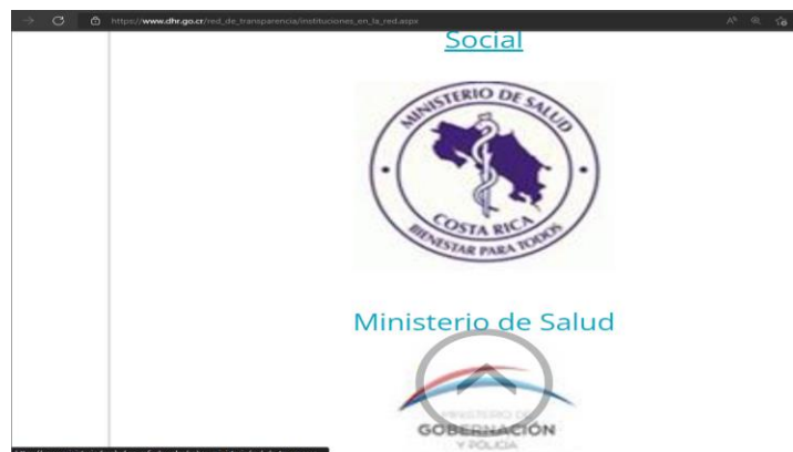
Ilustración 5 Desactualización de la URL en la página de la Defensoría de los Habitantes en la red de transparencia 2022