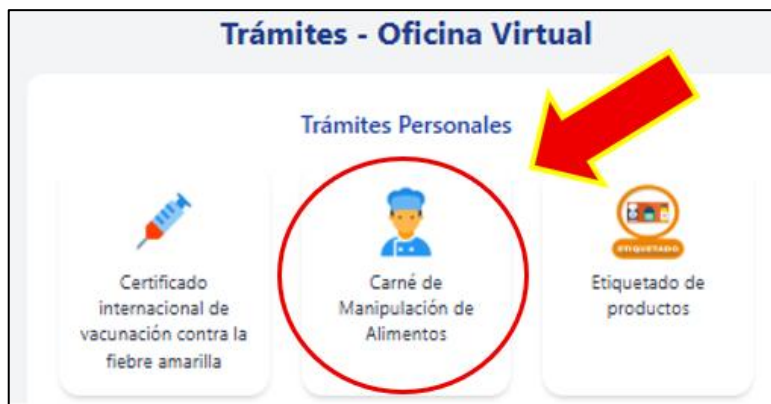
Ilustración 8. Carné manipulador de alimentos

Dar clic en la imagen de “Carné de Manipulación de Alimentos”