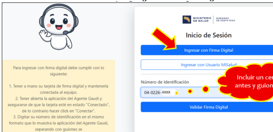
Ilustración 9. Ingreso con firma digital

Recuerde digitar su número de identificación con el formato cero adelante y guiones (04-0226-xxxx) y posteriormente haga clic en “validar firma digital”.