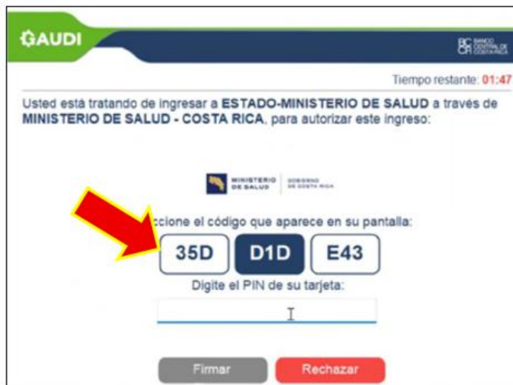
Ilustración 7. Autenticación de la firma digital

En la siguiente pantalla se despliega la verificación automática para ratificar la conexión de la firma digital y se debe digitar el pin de su tarjeta.