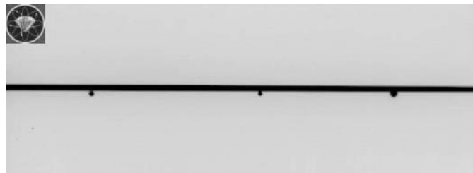
Figura 2. Imagen de los orificios y la línea correspondiente al campo de radiación.

Con respecto a la instrumentación, metodología y cálculo y análisis de resultados de esta prueba/ensayo, se debe considerar lo indicado en las páginas 132, 133 y 134 del documento IAEA-TECDOC-1958.