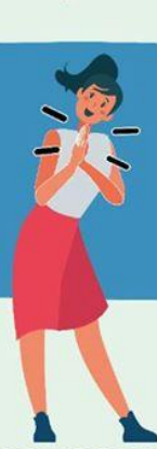
JUNTANDO LAS MANOS