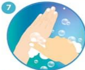
7 Rodeando el pulgar izquierdo con la palma de la mano derecha, frote con un movimiento de rotación y viceversa