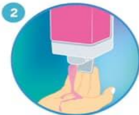
2 Aplique suficiente jabón