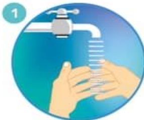
1 Humedezca las manos con agua y cierre el tubo

PARA RESTREGARSE LAS MANOS CANTE "CUMPLEAÑOS FELIZ" DOS VECES