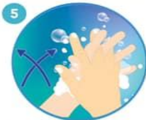
5 Frote las manos entre sí, con los dedos entrelazados