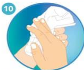
10 Sacuda muy bien las manos y séquelas idealmente con una toalla desechable