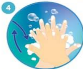
4 Frote la palma de la mano derecha sobre el dorso de la mano izquierda entrelazando los dedos, y viceversa