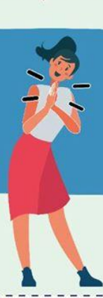
JUNTANDO LAS MANOS