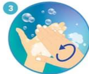
3 Frote sus manos palma con palma