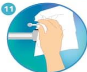
11 Use la toalla para cerrar la llave