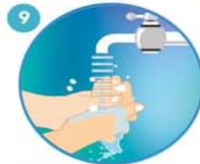
9 Enjuague abundantemente con agua