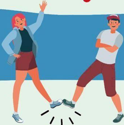
CON EL PIE