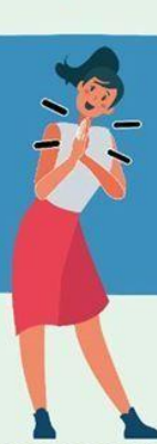
JUNTANDO LAS MANOS