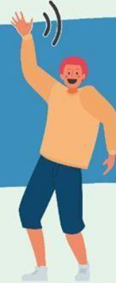
AGITANDO LAS MANOS