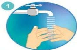
1 Humedezca las manos con agua y cierre el tubo

PARA RESTREGARSE LAS MANOS CANTE "CUMPLEAÑOS FELIZ" DOS VECES