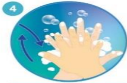
4 Frote la palma de la mano derecha sobre el dorso de la mano izquierda entrelazando los dedos, y viceversa