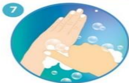
7 Rodeando el pulgar izquierdo con la palma de la mano derecha, frote con un movimiento de rotación y viceversa