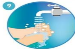
9 Enjuague abundantemente con agua