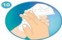
10 Sacuda muy bien las manos y séquelas idealmente con una toalla desechable