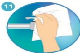
11 Use la toalla para cerrar la llave