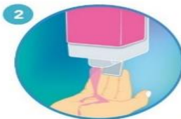
2 Aplique suficiente jabón