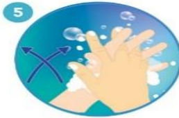
5 Frote las manos entre sí, con los dedos entrelazados