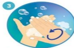
3 Frote sus manos palma con palma