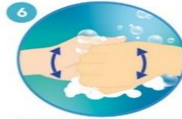
6 Apoye el dorso de los dedos contra las palmas de las manos, frotando los dedos