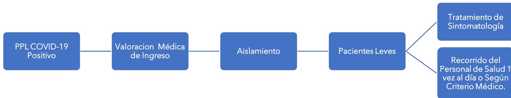
Figura 1. Ruta de acción en caso de personas privadas de libertad COVID-19 positivas de ingreso externo