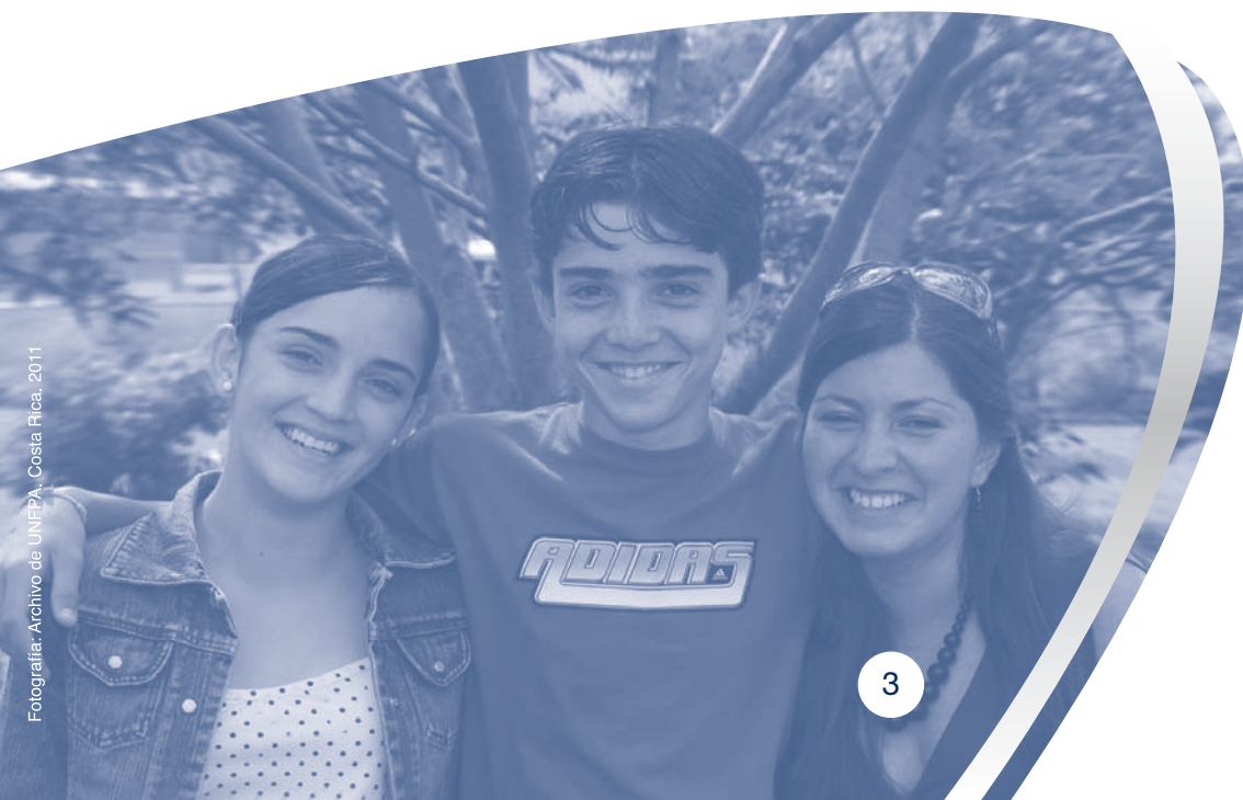
Fotografía: Archivo de UNFPA, Costa Rica, 2011