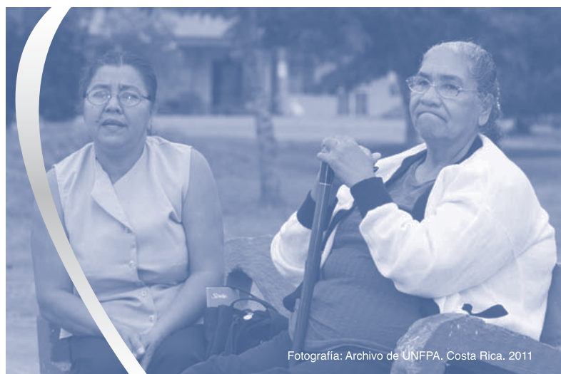
Fotografía: Archivo de UNFPA, Costa Rica, 2011