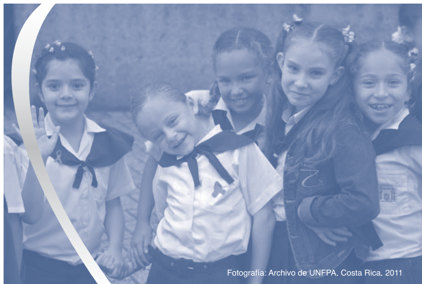
Costa Rica, 2011

Existen en el país una significativa cantidad de políticas públicas referidas a grupos poblacionales específicos o a dimensiones específicas de la vida de las personas que establecen, directa o indirectamente, prioridades y acciones estratégicas orientadas al ejercicio de los derechos humanos vinculados a la sexualidad.