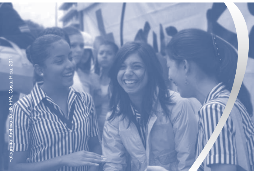
Fotografía: Archivo de UNFPA, Costa Rica. 2011

En tanto se respete la autonomía, la autodeterminación, la diversidad de de las personas y los derechos la atención a los asuntos ligados a sexualidad y reproducción se entenderán desde una perspectiva holística e integral. Para el efecto, se necesita además la implementación de un programa de educación para la sexualidad en el sistema educativo, libre de prejuicios, que promueva información veraz, científica y laica, y que estimule el respeto por la diversidad y la pluralidad de la sociedad costarricense. Esto como una manera de asegurar la posibilidad de las personas de construir una sexualidad libre y placentera.