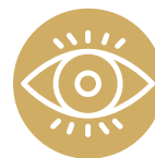
Color amarillo en la piel y los ojos