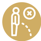
Orina oscura (color café) y orinar poco