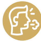
Dificultad al respirar