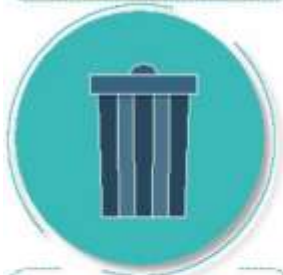
Después de tirar la basura