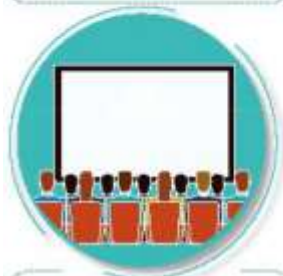
Luego de estar en zonas públicas