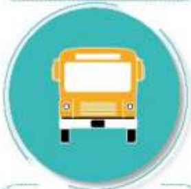
Después de utilizar el transporte público