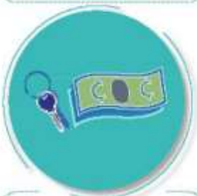
Después de tocar dinero o llaves