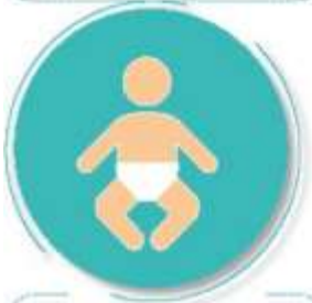
Antes y después de cambiar pañales