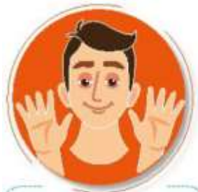
Antes de tocarse la cara