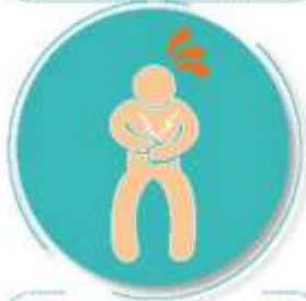
Después de visitar o atender una persona enferma