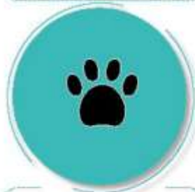
Después de estar con mascotas