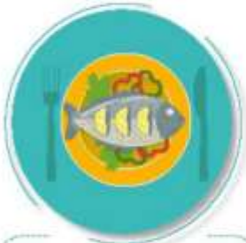
Antes de preparar y comer los alimentos