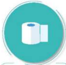
Después de ir al baño