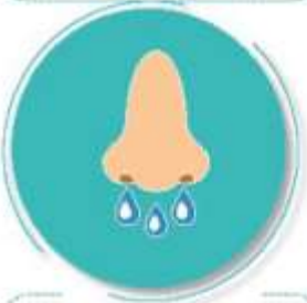
Después de toser o estornudar