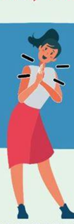
JUNTANDO LAS MANOS