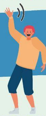
AGITANDO LAS MANOS