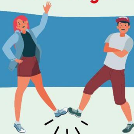
CON EL PIE