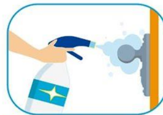
3 Limpiar las superficies de alto contacto