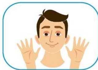
2 No se toque la cara si no se ha lavado las manos