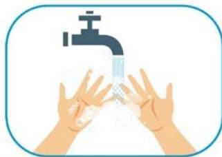
1 Lavado de manos