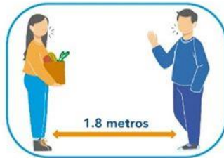
5 Distanciamiento social