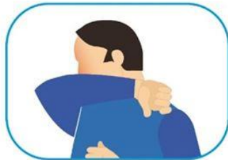
4 Protocolo de estornudo y tos