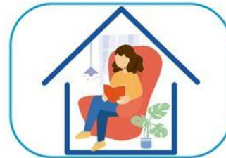
6 Quedate en casa