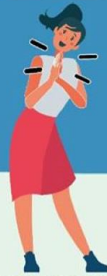
JUNTANDO LAS MANOS