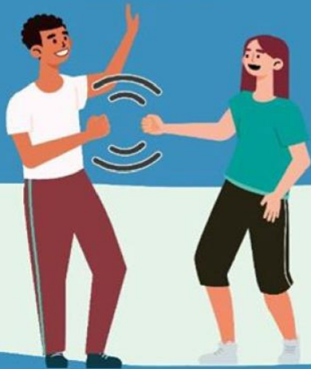
CON EL PUÑO DE LEJOS