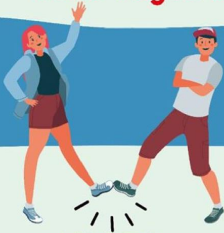
CON EL PIE