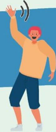
AGITANDO LAS MANOS