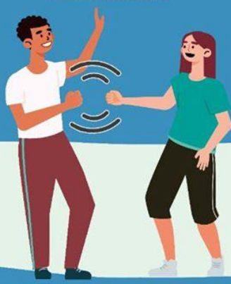
CON EL PUÑO DE LEJOS