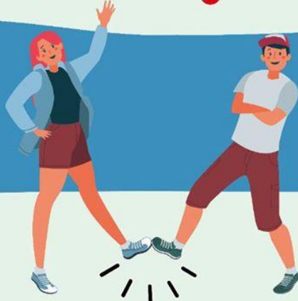
CON EL PIE