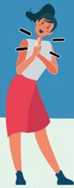
JUNTANDO LAS MANOS