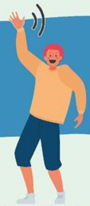
AGITANDO LAS MANOS