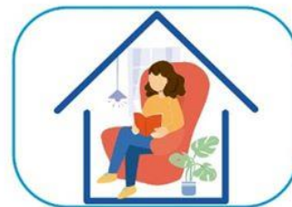
6 Quedate en casa